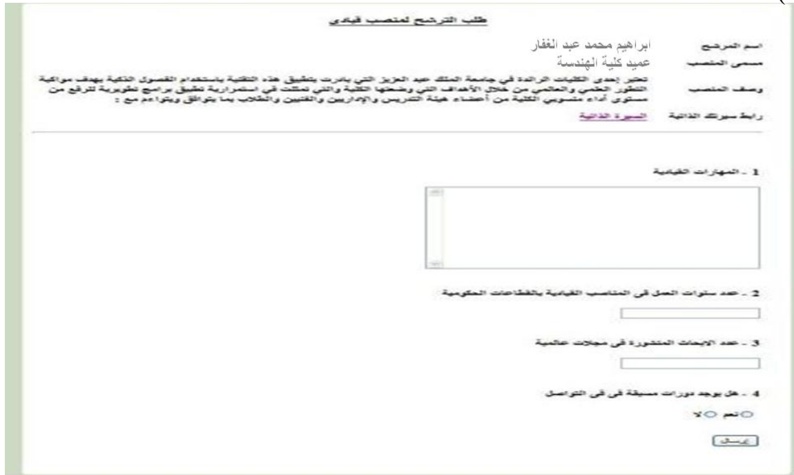
الشكل ( 2-16 )

ثم تظهر له رسالة بانتهاء ترشيحه للمنصب القيادي كما في الشكل (2-17).