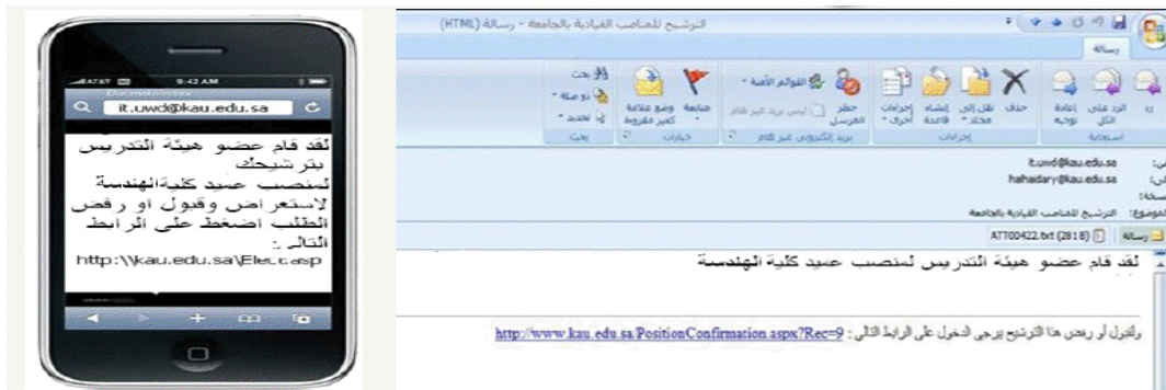
الشكل ( 2-13 )

ثم يصل للشخص الذي تم ترشيحه رسالة نصية على الجوال، ورسالة بريدية على البريد الإلكتروني تحتوي على رابط يعطي المرشح فرصة لقبول ترشيحه للمنصب أو رفضه لذلك كما يظهر في الشكلين (2-13) و (2-14).