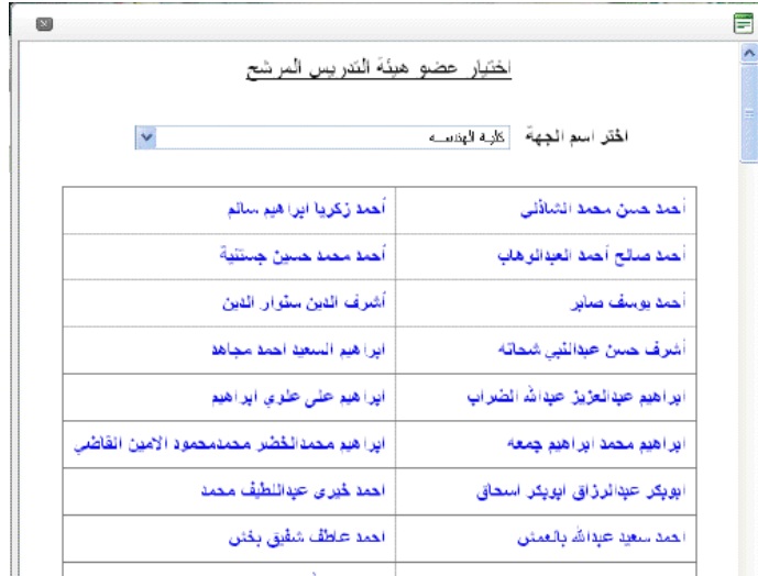
الشكل ( 2 - 10 )

ويتم الضغط على زر "اختيار" فتظهر (شاشة اختيار عضو هيئة التدريس المرشح) كما في الشكل (2 - 10) لاختيار اسم عضو هيئة التدريس الذي ترغب بترشيحه.