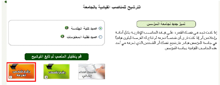
الشكل (2 - 7)

بعد الضغط على ايقونة نظام رشح ، تظهر كما في الشكل (2 - 7) ، ثم يختار المستخدم ايقونة " رشح شخص آخر " .