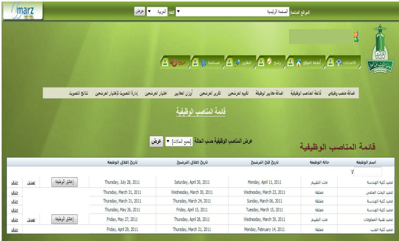
الشكل ( 4 - 1 )

تظهر الشاشة الرئيسية لنظام رشح متضمنة قائمة الوظائف كما في الشكل ( 4 - 1 ) :