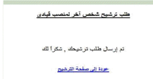
الشكل ( 2 - 12 )

ثم تظهر للمستخدم رسالة تأكيد بإرسال الطلب. كما في الشكل (2 - 12)