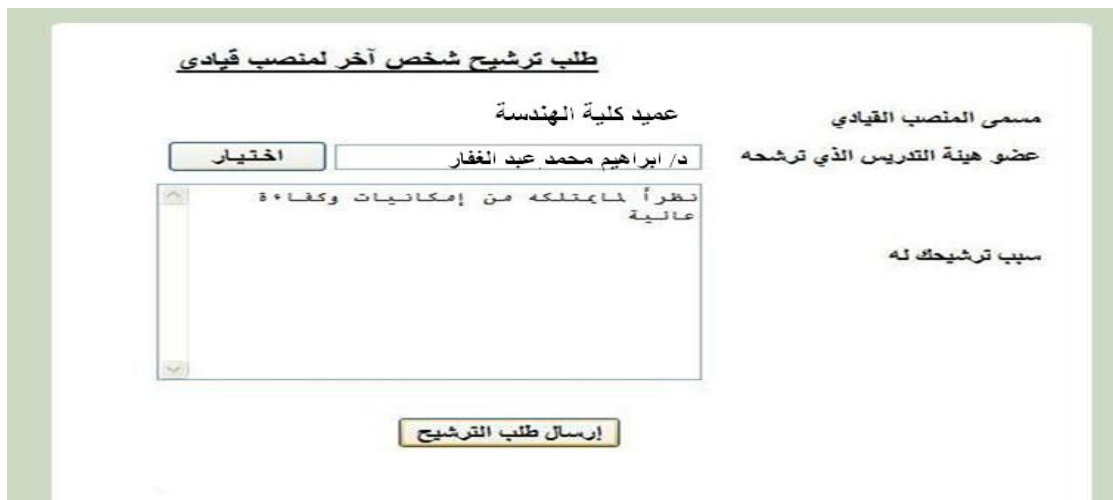
الشكل ( 2 - 11 )

ومن ثم تظهر (شاشة طلب الترشيح لعضو آخر بعد تعبئته) كتابة السبب في ترشيحك له ثم ارسال الطلب بالضغط على "ارسال طلب الترشيح" كما في الشكل (2 - 11).