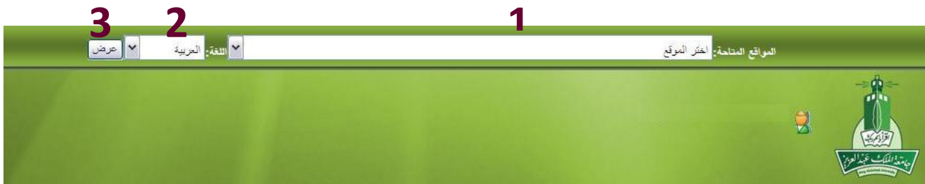
الشكل ( 2 - 1 )

بعد التأكد من صحة اسم المستخدم و كلمة المرور يتم الدخول على نظام مارس ويتم الدخول على صفحة الترحيب بالنظام ثم يتم اختيار الصفحة الرئيسية من القائمة المنسدلة (1) و الذي تم مسبقاً أخذ الصلاحية للتعامل معه ثم اختيار لغة الاستخدام (2) ثم الضغط على زر " عرض " (3) كما موضح بالشكل (1-2) :