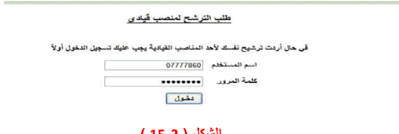
الشكل ( 2-15 )

عندما يفتح المرشح رابط القبول أو الرفض تظهر له (شاشة طلب الترشيح لمنصب قيادي) كما في الشكل (2-15)