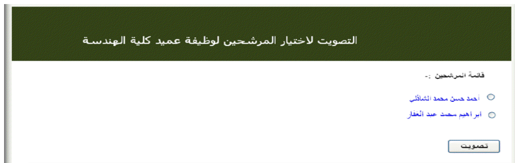
الشكل ( 3 - 2 )

تظهر للمستخدم قائمة بأسماء الأشخاص المرشحين للمنصب القيادي، يختار المرشح الأفضل ويضغط على زر "تصويت"، كما يظهر في الشكل (3 - 2)