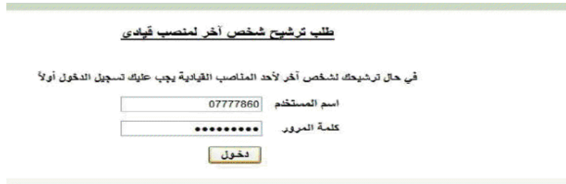
الشكل (2 - 8)

(2 - 8) فيتم ادخال اسم المستخدم وكلمة المرور الخاصة بالمستخدم.