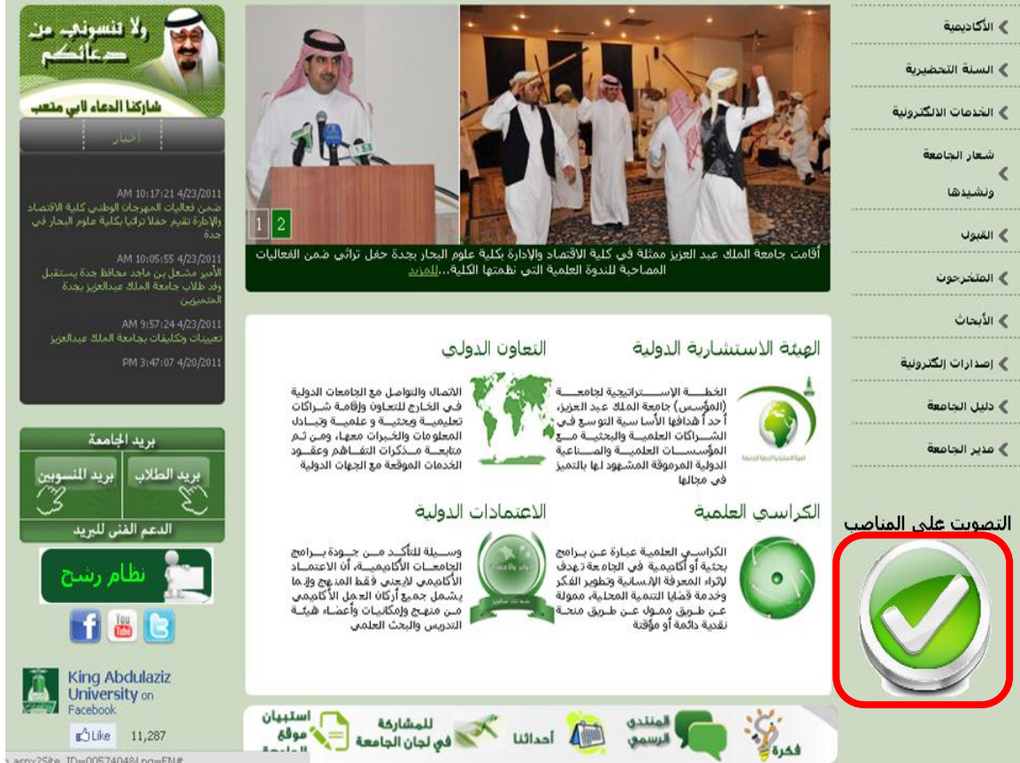
الشكل ( 3 - 1 )

كيفية التصويت للمرشحين للمناصب القيادية في الجامعة: يستطيع المستخدم التصويت للمرشحين الذين تم طرح أسمائهم للتصويت في نظام "رشح" كالتالي: يختار أيقونة "التصويت" من الصفحة الرئيسية لموقع الجامعة كما في الشكل (3-1).