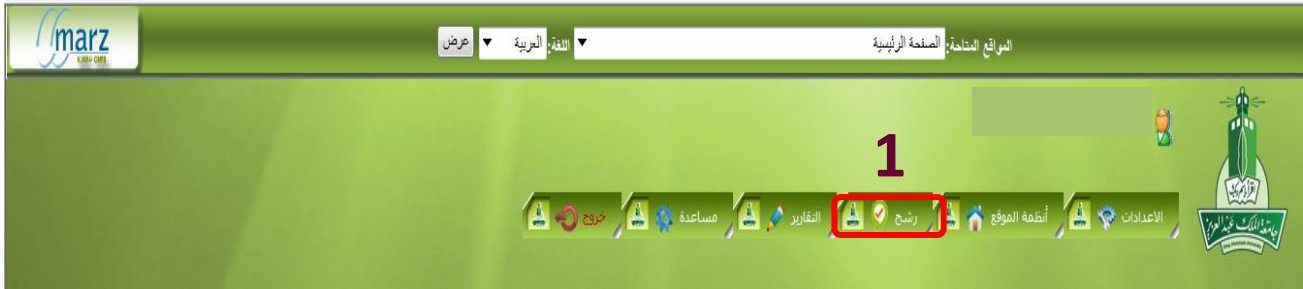
الشكل ( 3 - 1 )

فتظهر لنا الانظمة الرئيسية للموقع والتي من خلالها يتم التحكم في الموقع وفقاً للصلاحيات المعطاه كما ذكر مسبقاً وللدخول على صفحة نظام رشح نختار "ايقونة رشح" رقم (1) كما في الشكل ( 3 - 1).