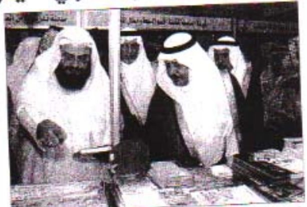
الأمرير نايف مع أعضاء اللجنة الوطنية لحقوق الإنسان في جامعة أم القرى