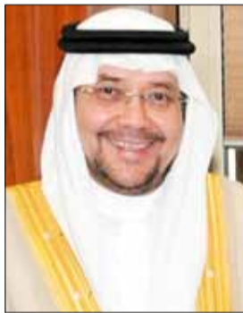
وكيل الجامعة للدراسات العليا والبحث العلمي

الحمد لله رب العالمين، والصلاة والسلام على سيدنا محمد صلى الله عليه وسلم. دأبت جامعة المؤسس على الاحتفاء في يوم الوفاء والعرفان والتقدير، معتبرة هذا اليوم يوماً متميزاً تحرص على تنظيمه كل عام، يوم نلتقي فيه بزملاء وإخوان تشرفنا بالعمل معهم وبزملائهم، فكانوا نعم السواعد التي بنت وشيدت فأجادوا وأثمر عطاؤهم. إن من بين المحفты بهم اليوم زملاء ساهموا بعلمهم وأبحاثهم ودراساتهم في تطوير الدراسات العليا، وقدموا خدمات جليلة لتطوير البحث العلمي أسهموا في الارتقاء ببرامج الدراسات العليا، واليوم نجدها فرصة لتقديم الشكر لهم على ما عطائهم الجزيل. واليوم ونحن نقف وقفة وفاء ندعو لهم بالتوفيق، ونتضرع إلى الله عز وجل أن يعين الأجيال الأخرى على إكمال المسيرة التي قادوها من قبلنا. إن إخواننا وأخواننا المتفادين لم تنته جهودهم في خدمة الجامعة، وإنما هم في مرحلة انتقالية من ميدان إلى ميدان، فالوطن بحاجة إلى جهودهم وعطائهم، فالواجب يحتم الاستمرار في البذل والعطاء، وتقديم النصيحة لجامعتهم الأبية، والأمانة تتطلب منهم تقديم الدعم والعون للأجيال القادمة ليستلموا الأمانة ولتبقى الجامعة في أيدي أمينة تحرص على ازدهارها وتطويرها لبلوغ مستويات أعلى من التقدم والازدهار. يأتي هذا التكريم عرفاناً وتقديراً للتميزين والمتفادين شكراً لهم على ما بذلوه من دور فاعل خلال السنوات التي قضوها بين أروقة الجامعة، وتقديراً لعطائهم في خدمة الجامعة، والإسهام في ازدهارها.. اليوم نقف وقفة لتكريم المتفادين والتميزين، داعين لهم بالتوفيق والسداد في حياتهم المقبلة، سائلين لهم دوام الصحة والعافية، وفقنا الله وإياكم لما يحبه ويرضاه، إنه سميع مجيب.