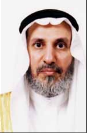
وكيل الجامعة للمشاريع