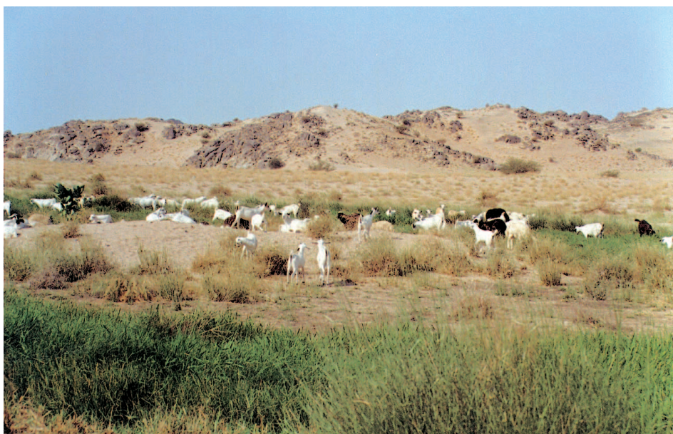
شكل (٣). صورة توضح نمو النباتات عشوائياً حول ضفاف مجرى مياه الصرف الصحي لمدينة مكة المكرمة بوادي عرنة .