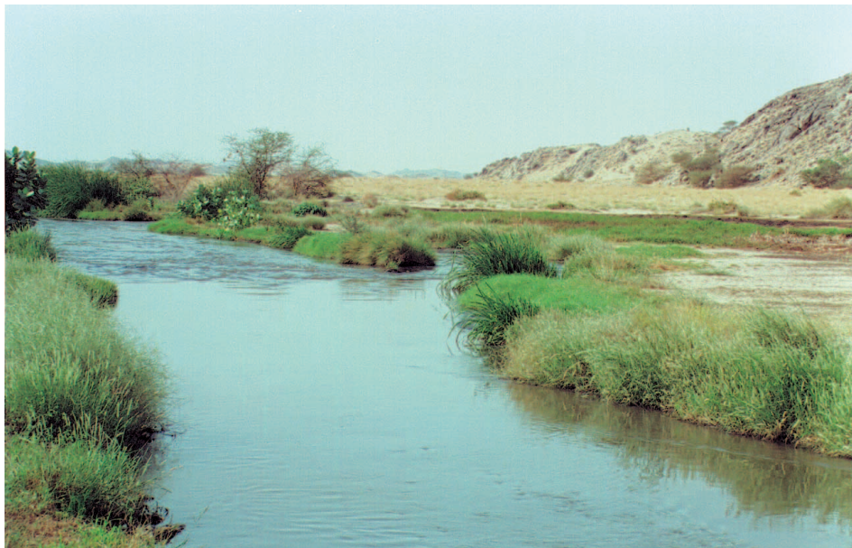
شكل (٢). صورة توضح مجرى مياه الصرف الصحي لمدينة مكة المكرمة بوادي عرنة .